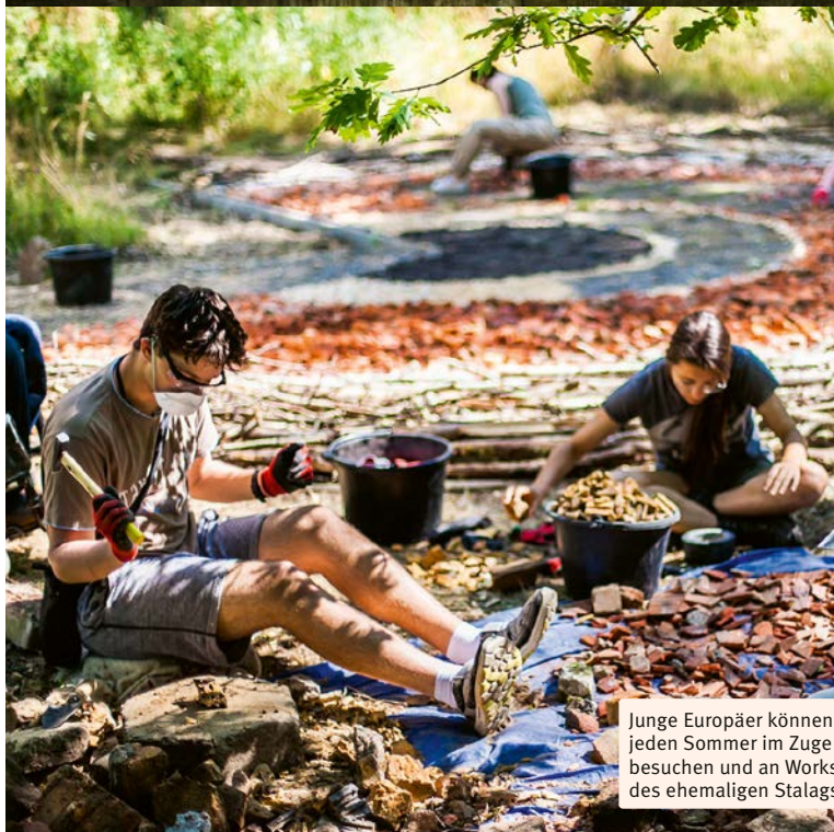
Junge Europäer können die Gedenkstätte jeden Sommer im Zuge der »Worcation« besuchen und an Workshops auf dem Gelände des ehemaligen Stalags VIII A teilnehmen.