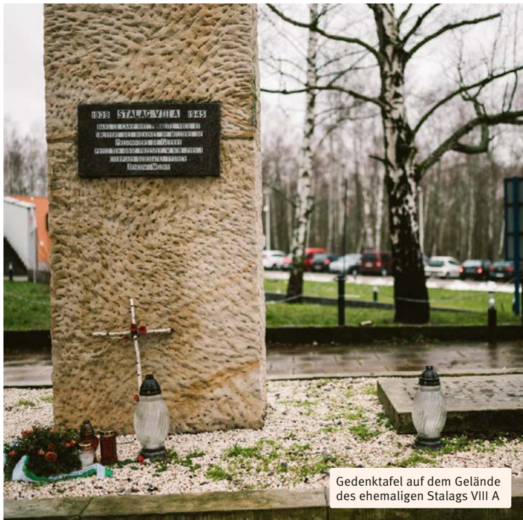
Gedenktafel auf dem Gelände des ehemaligen Stalags VIII A