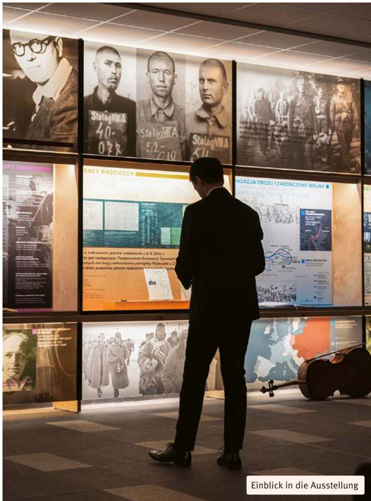
Einblick in die Ausstellung