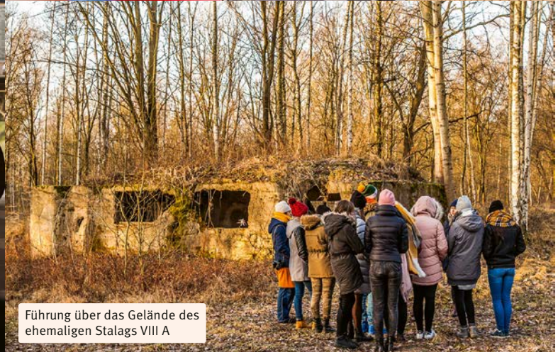
Führung über das Gelände des ehemaligen Stalags VIII A

Schulklassen und Jugendliche bietet das Europäische Zentrum ein breites Bildungsprogramm an, welches von Führungen bis zu mehrtägigen deutsch-polnischen Gedenkstättenfahrten reicht. Dabei werden stets Elemente der aktiven Beteiligung der Lernenden integriert und Hilfestellungen beim Finden einer jeweiligen deutschen oder polnischen Partnergruppe geboten.