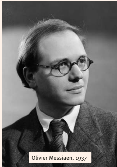
Olivier Messiaen, 1937