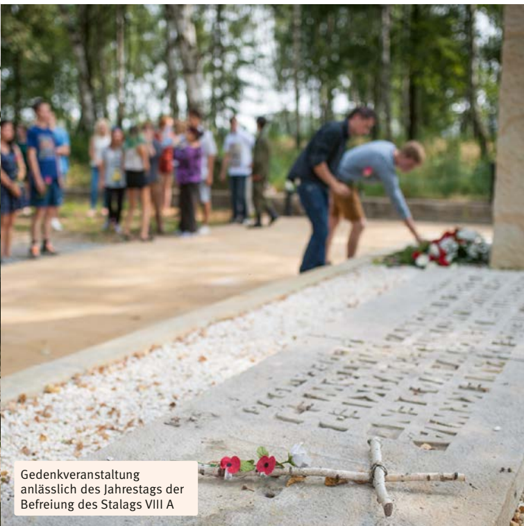
Gedenkveranstaltung anlässlich des Jahrestags der Befreiung des Stalags VIII A