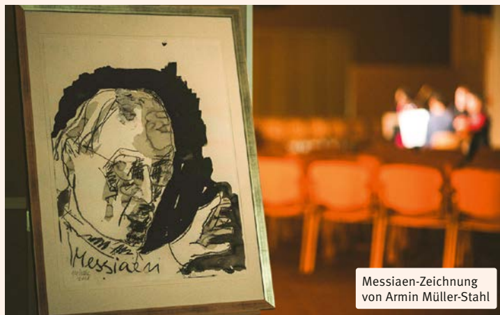
Messiaen-Zeichnung von Armin Müller-Stahl

Doch noch einmal hält Messiaen inne, beschwört Regenbogen und Engel in seinem sich selbst zitierenden Feuerwerk, mit dem das eigentliche Ende der Zeit erst noch angekündigt werden soll.