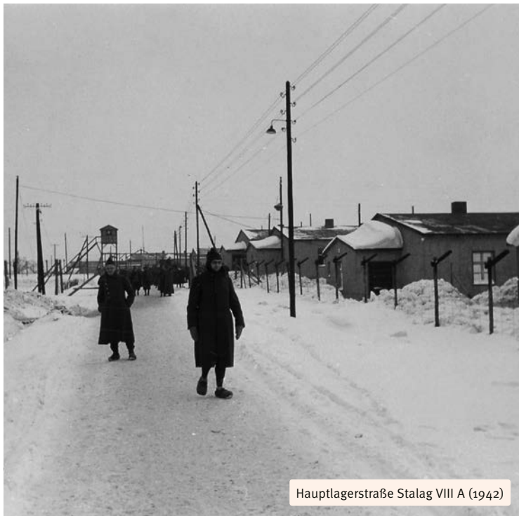
Hauptlagerstraße Stalag VIII A (1942)