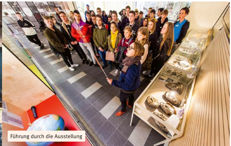
Führung durch die Ausstellung