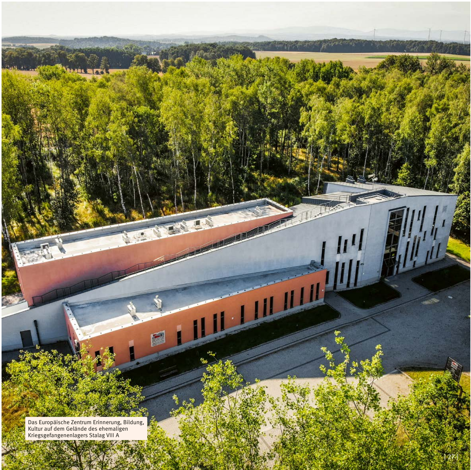
Das Europäische Zentrum Erinnerung, Bildung, Kultur auf dem Gelände des ehemaligen Kriegsgefangenenlagers Stalag VIII A