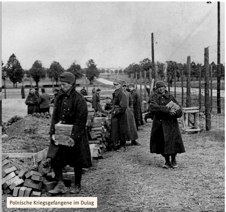
Polnische Kriegsgefangene im Dulag

daten, vom NS-Staat als nicht dem Schutz der Genfer Konvention unterstehend betrachtet, hatten im Gegensatz zu den weiteren Kriegsgefangenen keinen Zugang zu Funktionsbaracken wie der Kapelle, der Bibliothek oder der sogenannten Theaterbaracke. Zudem war es ihnen untersagt, sich im Lager an sportlichen oder kulturellen Aktivitäten zu beteiligen.